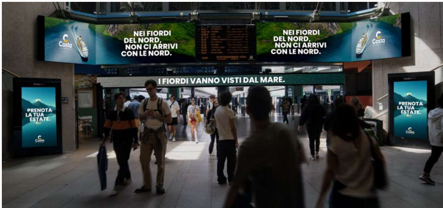
I nuovi pannelli installati alla stazione ferroviaria di Milano Cadorna ((Credits: LePub – Global Creative Partner)

Dopo il lancio della nuova campagna di comunicazione dedicata all'estate 2026, Costa Crociere amplia ulteriormente la propria presenza sul territorio con una importante attivazione DOOH (Digital Out Of Home), pensata per portare la meraviglia delle esperienze uniche da vivere solo con Costa direttamente negli spazi urbani più iconici di Milano. L'attivazione DOOH si inserisce all'interno della piattaforma globale "Wonder" e della strategia Sea & Land, dando voce a una promessa unica: "Only Costa brings you there, where wonder happens". Un messaggio che pone al centro il valore del "where": i luoghi straordinari in cui la meraviglia prende forma, e l'unicità di Costa come unico brand capace di creare destinazioni esclusive, sul mare e a terra.