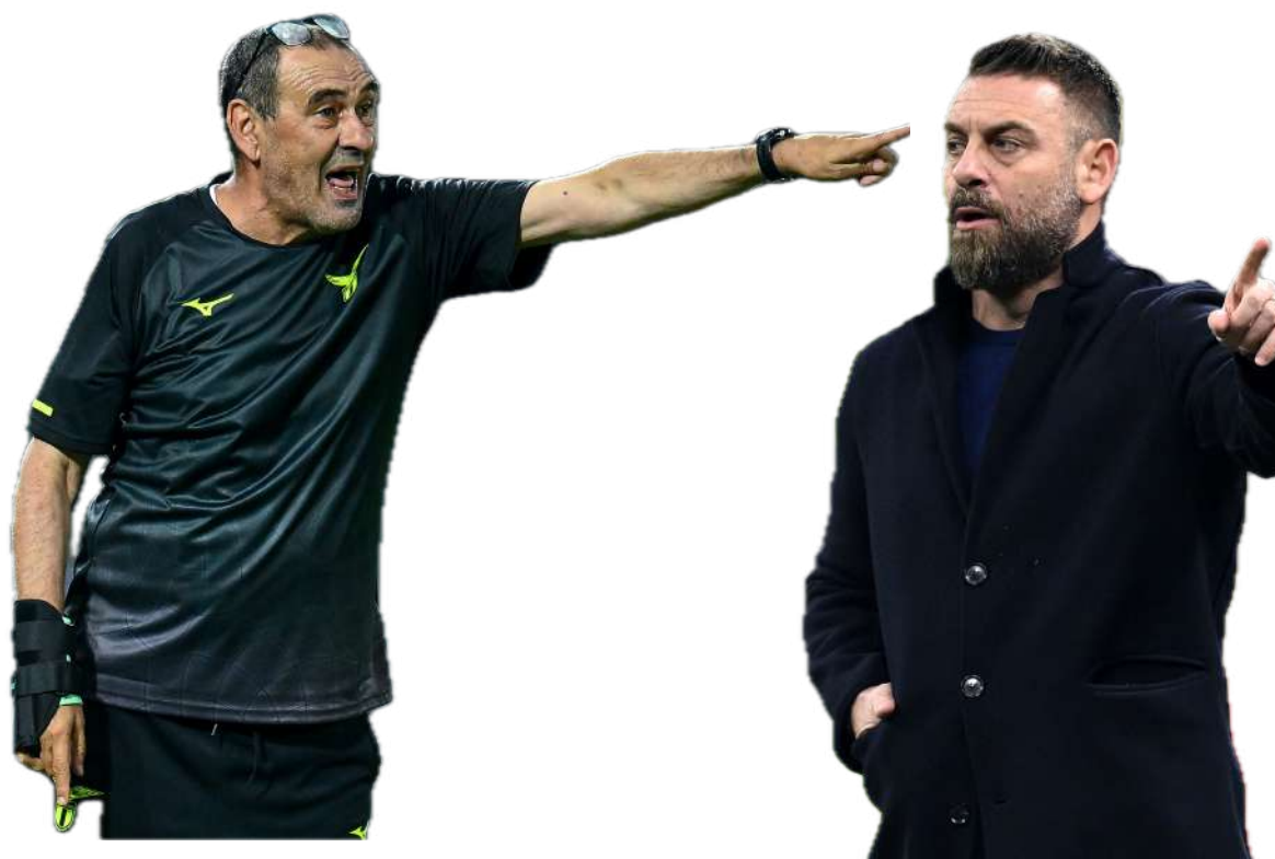
Maurizio Sarri e Daniele De Rossi, protagonisti in panchina nella sfida dell'Olimpico