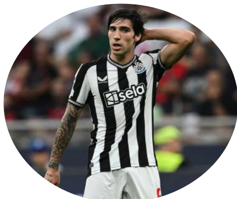
Nella foto Sandro Tonali centrocampista del Newcastle