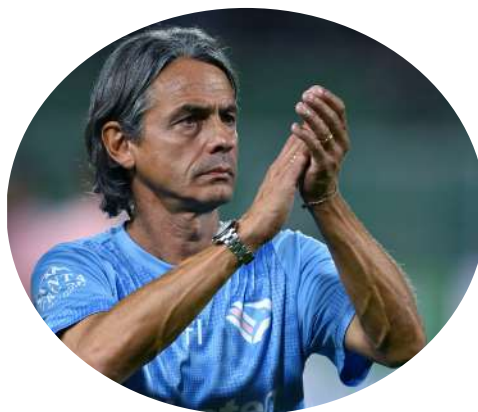
Accanto IPippo Inzaghi tecnico del Palermo