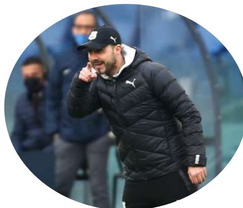
Nella foto accanto Roberto De Zerbi tecnico del Marsiglia