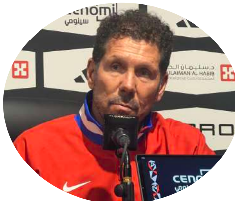
Nella foto Diego Simeone tecnico dell'Atletico Madrid