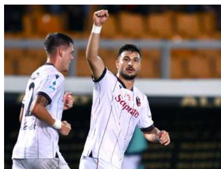
Riccardo Orsolini