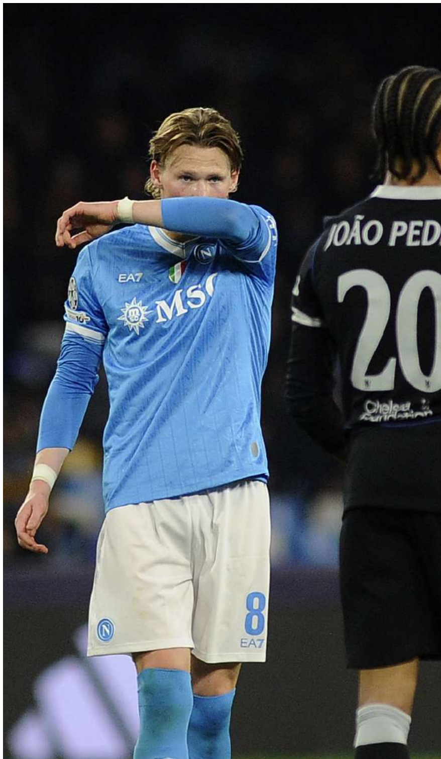
Scott McTominay