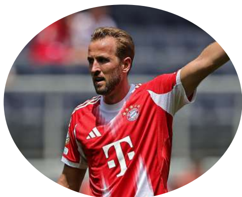
Nella foto Harry Kane fuoriclasse del Bayern Monaco